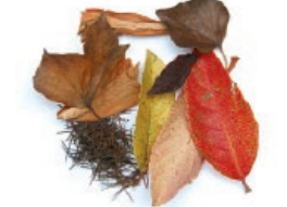
Lorategi edo baratzeko hondarrak / Restos del jardín o de la huerta

LOS ENVASES AL CONTENEDOR AMARILLO ONTZI ARINAK EDUKIONTZI HORIRA