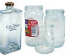
Beirazko ontziak / Tarros de vidrio

Recicla el vidrio sin tapas ni tapones Birziklatu beira, tapa eta tapoirik gabe