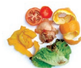
Barazki eta fruta hondarrak / Restos de fruta y verdura

Recicla la orgánica usando siempre bolsas compostables Birziklatu organikoa, beti poltsa konpostagarriak erabiliz