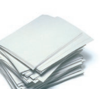
Paperezko orriak / Hojas de papel