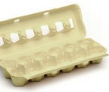
Kartoizko arrautza-ontziak / Hueveras de cartón

EL VIDRIO AL CONTENEDOR VERDE BEIRA EDUKIONTZI BERDERA