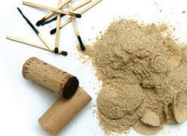
Kortxoak, zerrautsa, eta pospoloak / Corchos, serrín y cerillas