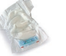
Pixoihalak eta konpresak / Pañales y compresas