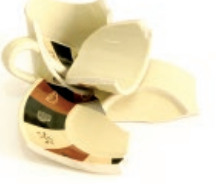
Zeramika hondarrak / Restos de cerámica

Productos que no se pueden reciclar Birziklatu ezin diren produktuak