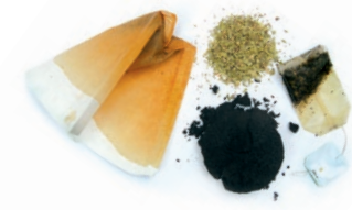
Kafe eta infusio hondarrak / Marro del café y restos de infusiones