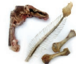
Haragi eta arrai hondarrak / Restos de carne y pescado