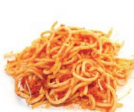
Sukaldatutako janaria (pasta, arroza, ...) / Comida cocinada (pasta, arroz...)