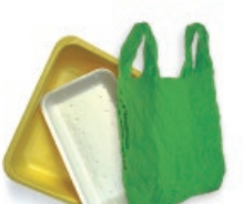
Porexpanezko erretiluak eta plastikozko poltsak / Bandejas de porexpan y bolsas de plástico