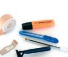
Besteak / Otros