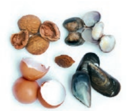
Arrautza eta marisko oskolak, fruitu lehorrak / Cáscaras de huevo, frutos secos y marisco