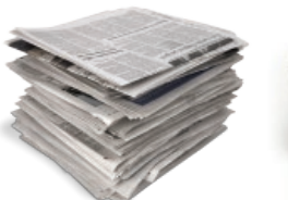
Egunkariak eta aldizkariak / Periódicos y revistas