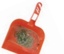
Errazte-hondarrak / Restos de barrido