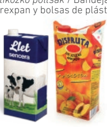
Brikak / Bricks

EL PAPEL Y CARTÓN AL CONTENEDOR AZUL PAPERA ETA KARTOIA EDUKIONTZI URDINERA