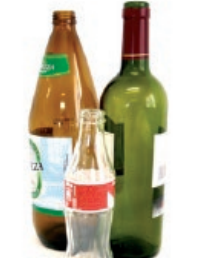
Beirazko botilak / Botellas de vidrio

EL RESTO AL CONTENEDOR GRIS EREFUSA EDUKIONTZI GRISERA