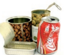
Latak / Latas

Recicla los envases quitándoles el aire para reducir el volumen Birziklatu ontziak, airea kenduta, bolumena txikitzeko