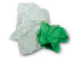
Sukaldeko papera eta musuzapiak / Papel de cocina y servilletas