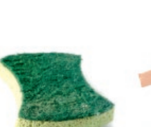
Espartzua / Estropajo