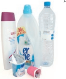
Plastikozko ontziak / Envases de plástico