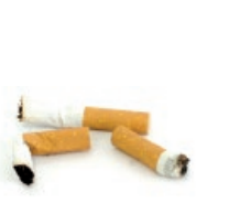
Zigarrokinak / Colillas de cigarros