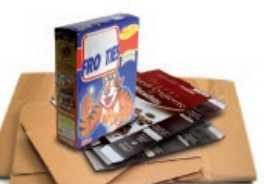
Kartoizko kaxak eta ontziak / Cajas y envases de cartón

Recicla el papel y cartón bien plegado y sin bolsas de plástico Birziklatu papera eta kartoia, ongi tolestuta eta plastikozko poltsarik gabe